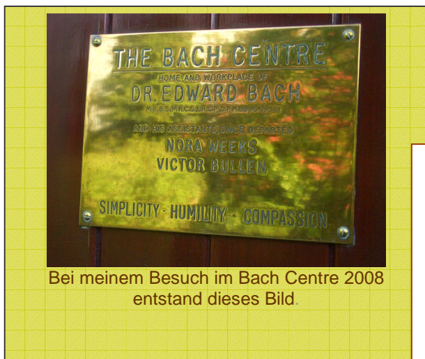
Bei meinem Besuch im Bach Centre 2008 entstand dieses Bild.

Sie sind etwas ganz besonderes, die Seminare aus dem Internationalen Ausbildungsprogramm der Dr. Edward Bach Stiftung, denn näher am Ursprung geht es wirklich nicht.