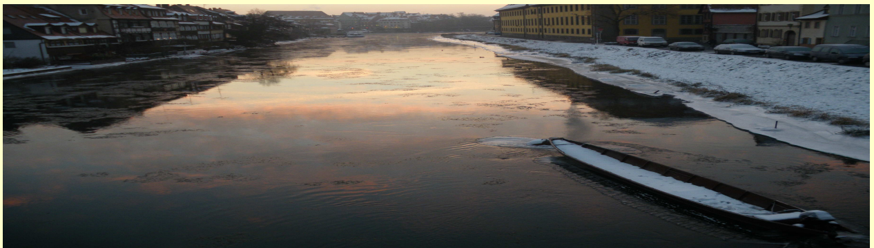
Auf dem Weg zur Praxis habe ich im letzten Winter dieses Bild festgehalten. Ob es heuer wieder so eisig wird?