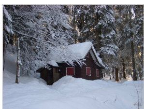
Winterpause im Bachblütengarten